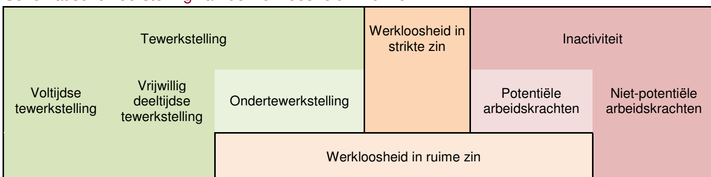
Tabel 3 Schematische voorstelling van de werkloosheid in ruime zin

Door deze marges in beschouwing te nemen, bekomen we een definitie van werkloosheid in ruime zin, die toelaat het overzicht van de werkloosheid in strikte zin van tabel 1 te nuanceren.